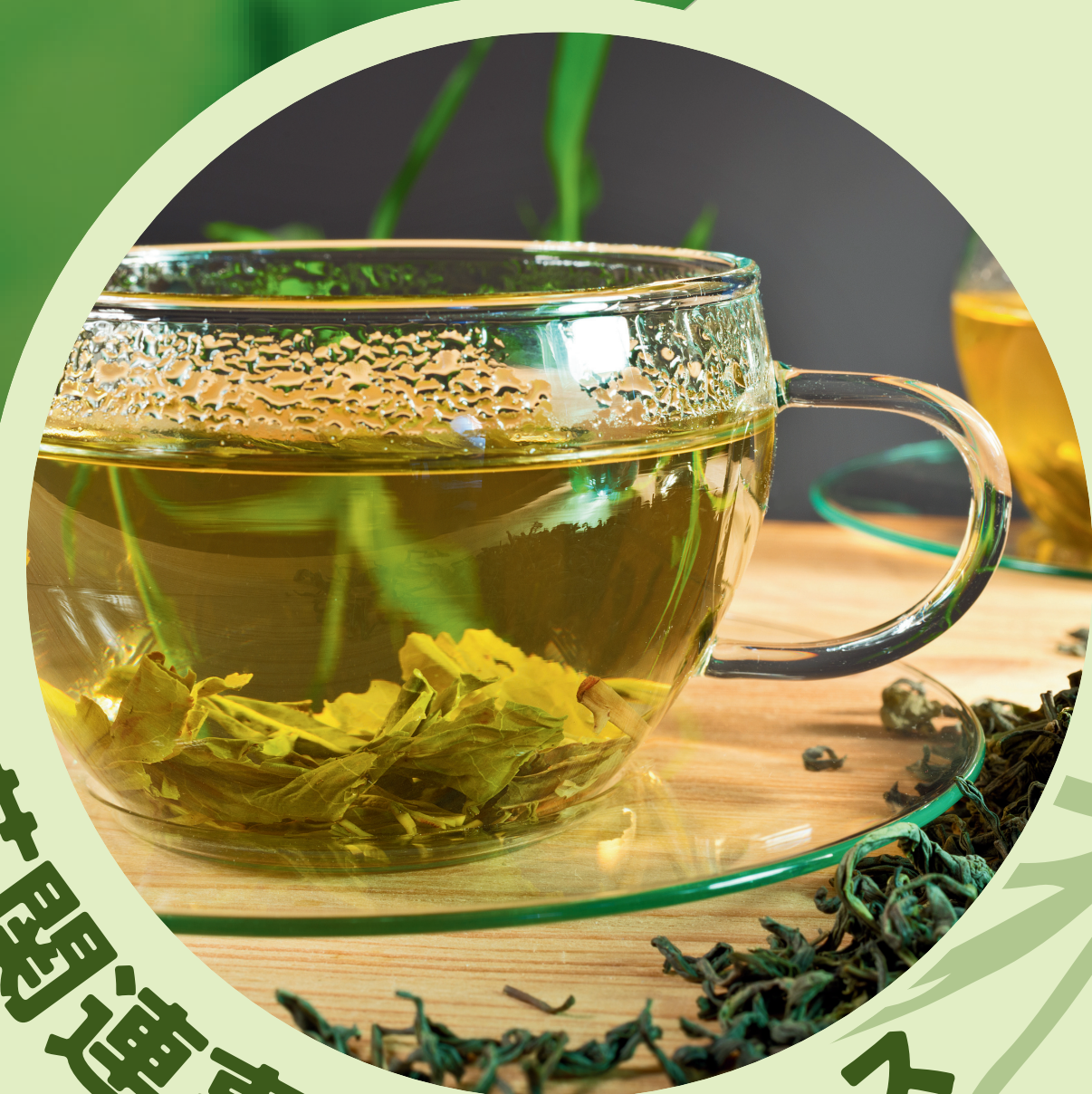
茶関連事業者ブース