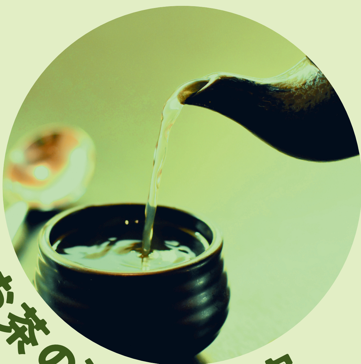
お茶の淹れ方教室