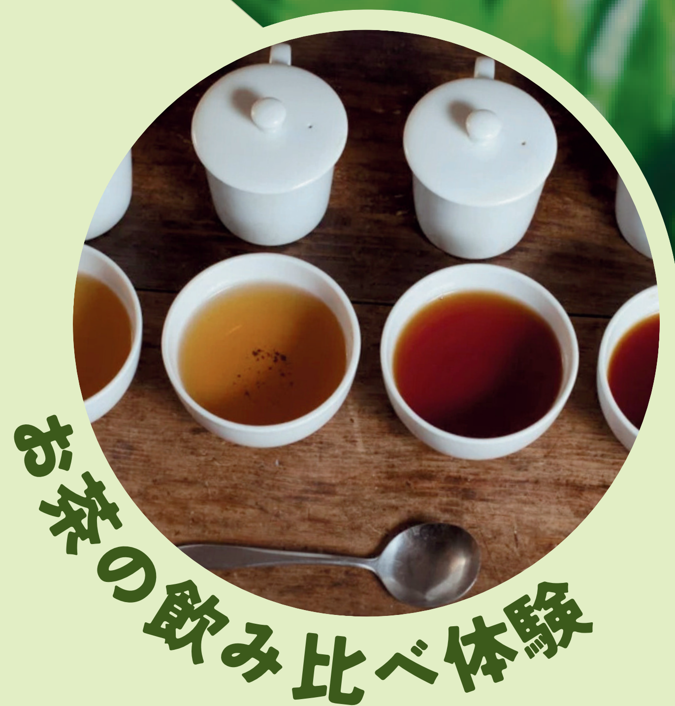
お茶の飲み比べ体験